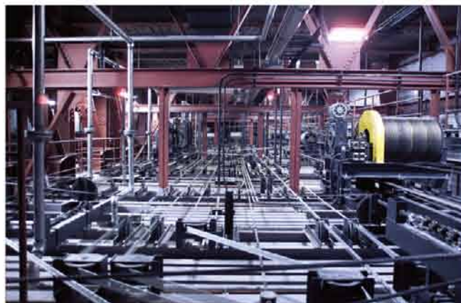
ブドウ棚上マシン設置