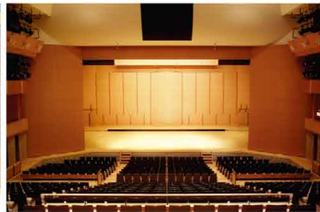
可動プロセニウム表側