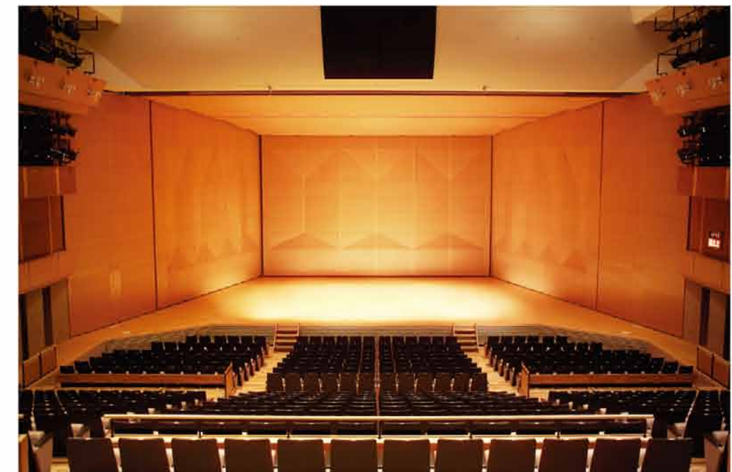
音響反射板セット完了