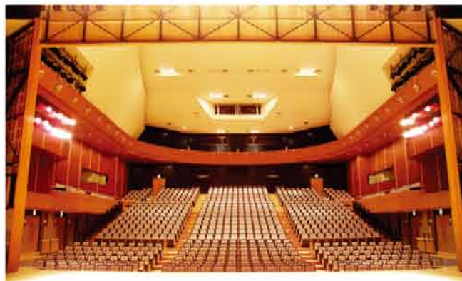
可動プロセニウム裏側